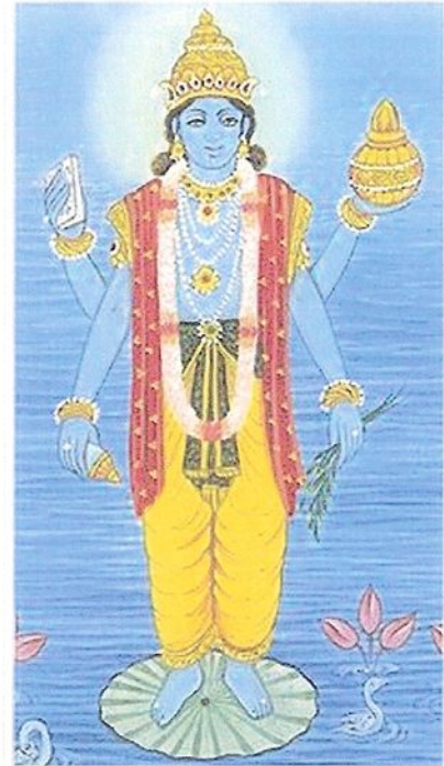
Imagen del médico Dhanwantari, convertido en un avatara del dios Vishnú (y como él, de cuatro brazos). Los hinduistas creen en el origen divino del Āiur Vedá .

El Āiur Veda desarrolla la sabiduría acerca de las características de los organismos, que en medicina hindú conocen como dosha (‘humores’ o ‘aires vitales’, aunque desde fines del siglo XX se prefiere